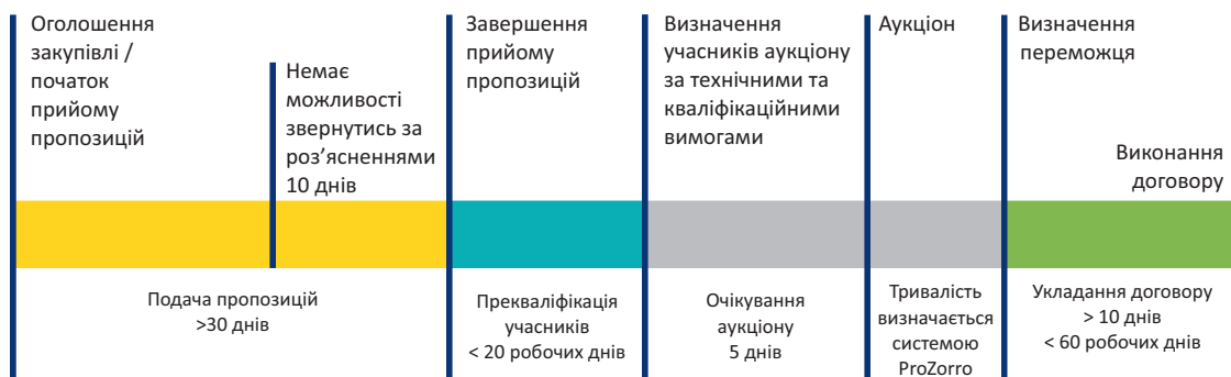
Рис. 3. Строки та етапи процесу закупівель