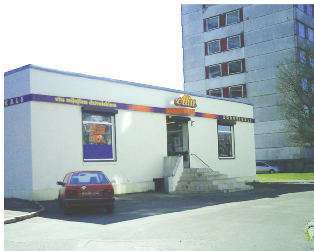
После реализации программы по установке ИТП в жилых домах ЦТП «превратилось» в зоомагазин (г. Рига). (Новости теплоснабжения № 9 (сентябрь); 2005 г.)