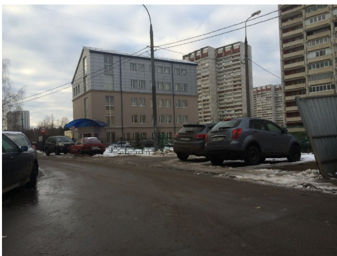
5-ти этажное здание в Зеленограде, построенное на месте ЦТП