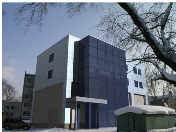
Проект реконструкции здания ЦТП № Ц15 по ул. Весенняя, 18/1 в Завельцовском районе г. Новосибирска с надстройкой 2-х этажей, пристройкой входного блока с лестничной клеткой. Здание ЦТП до реконструкции (слева) и после (справа).